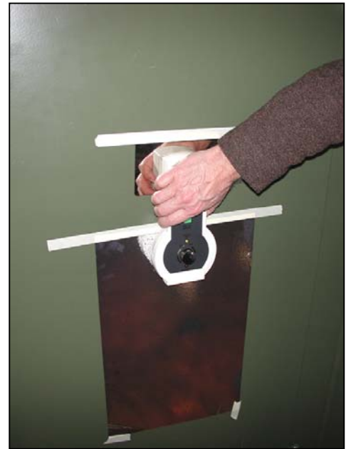
Relève d'une marque poussiéreuse sur une surface verticale

Dépister et protéger des justificatifs évidents, comme traces pneumatiques ou empreintes, ne causera aucun problème. Ce sont les empreintes non visibles qui sont difficiles à localiser et qui peuvent être effacés ou abîmés pendant la préservation des traces. Nous parlons des empreintes poussiéreux.